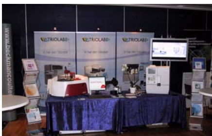
Her ses vores stand på DSKB, som blev afholdt i Aalborg i maj 2011.

Vanen tro har Triolab også i år deltaget på udstillinger og konferencer, hvor vi har vist et udvalg af vores produkter frem. På DEKS/NML-kongressen, som blev afholdt i DGI-Byen i København den 13.-15. september var Triolab hovedsponsor.