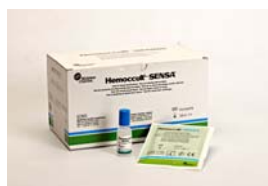
Hemocult Sensa – guajak-baseret test