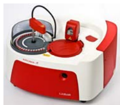
KROMA iT - fuldautomatisk instrument til immunologisk bestemmelse