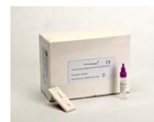
HemoSure – immunologisk test