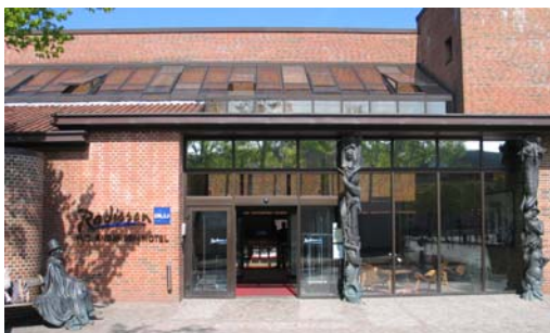
Brugermødet blev holdt på H.C. Andersen Hotel i Odense.

Onsdag den 19. maj holdt vi brugermøde på Nova 8 CRT til S--Calcium (frit); stofk (pH 7,4). 20 brugere fra klinisk biokemisk afdelinger rundt om i Danmark deltog i arrangementet.