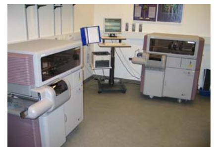
Koagulationslaboratoriets 2 STA-R Evolution-apparater

Koagulationsanalyserne fordeles på de to apparater sådan, at der på det ene apparat køres rutineanalyser, og på det andet køres der specialanalyser - én uge ad gangen, så bytter man. Det giver en god udnyttelse af apparaterne at opdele analyserne på den måde, og i og med at man jævnligt bytter over, sikrer man, at belastningen på de to apparater er nogenlunde ens.