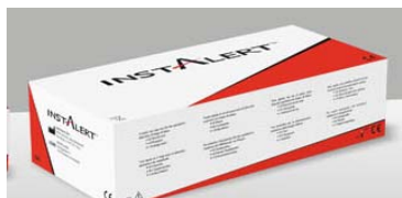
U-hCG (honorarkode 7175)

Triolab er i forårshumør, og indtil den 30. juni 2010 tilbyder vi 25 % rabat på graviditetstesten InstAlert™ U-hCG (ABO / FHC-102) . Kontakt os og hør din pris.