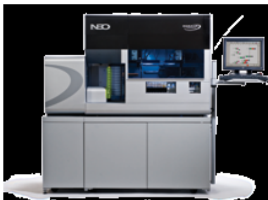
* Galileo Neo™